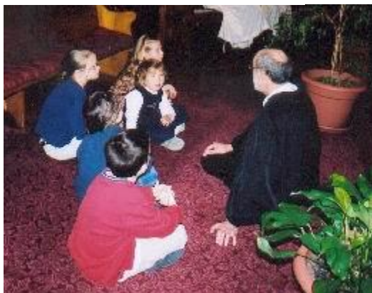
Le temps des enfants