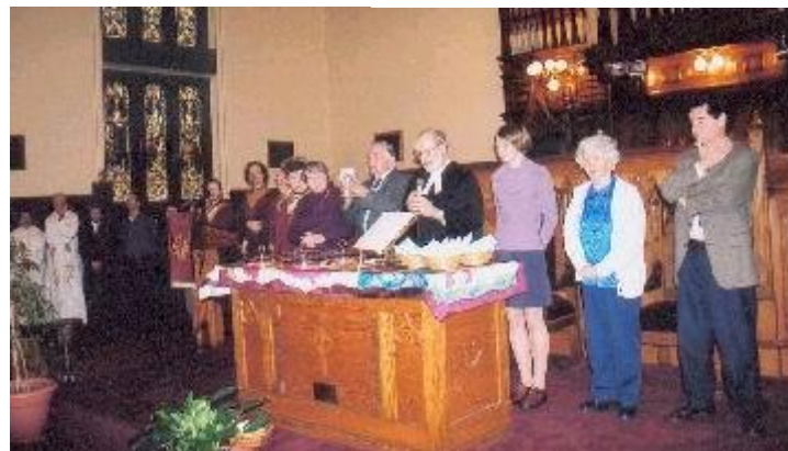
La célébration de la Sainte Cène